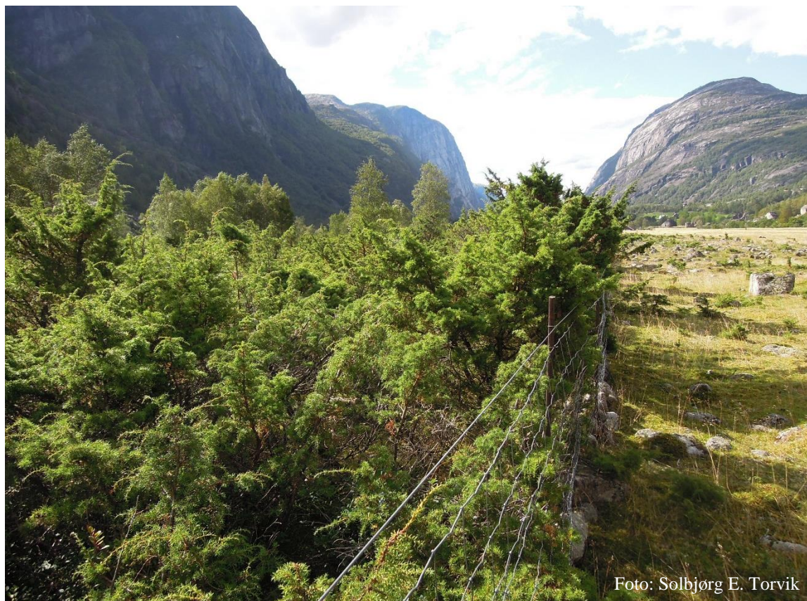
Tyttebæråkeren til venstre og Viltåkeren til høyre i bildet.