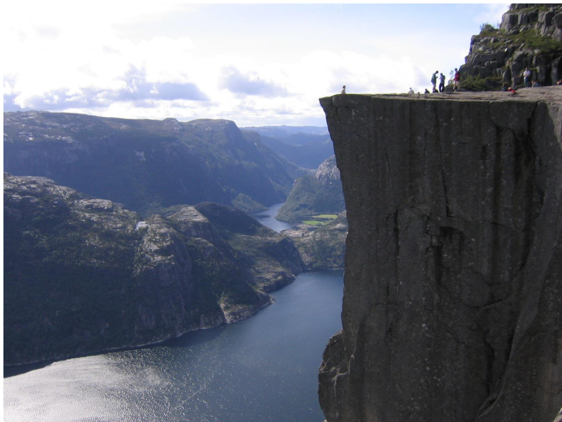
Utsikt fra Preikestolen-området mot Nedre Eiane og Eiavatnet.

Eiane ligger i et område som brukes både av turister og friluftsfolk. Eiane har ikke mye tilrettelegging for denne virksomheten, men sjokoladefabrikken med utsalg og kurs, flere T-merka stier samt parkeringsplassen på Skrøyla som er utgangspunktet for mange flotte turer er slike tilrettelegginger.