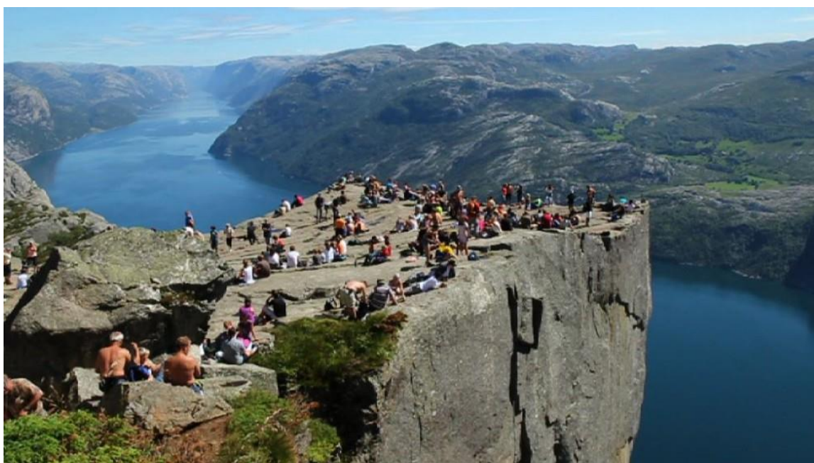
Utsikt fra Preikestolen innover Lysefjorden og over mot Fossmork på andre sida av fjorden.

Kulturlandskapet på Fossmork holdes i god hevd av grunneiere eller andre som har dette som levevei, enten alene eller i tillegg til annet. RMP-Lysefjordtilskuddet har hatt stor betydning for at arbeidet skal gå i null økonomisk. Det vurderes likevel ikke som avgjørende for om en fortsetter med sauer og skjøtsel her på kort sikt. Sauehold og storfehold er hobby eller del av aktivt arbeid og egeninteressen for å skjøtte og holde egen eiendom i hevd, åpen og fin er viktig drivkraft.