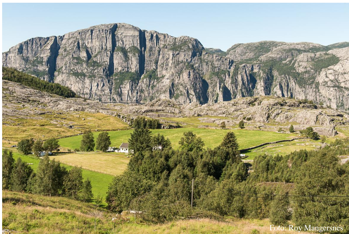
Myrane på Fossmork sett fra veien, med fjellpartiet med Preikestolen i bakgrunnen.

Tilstanden på Fossmark er generelt god da dette er et levende kulturlandskap hvor det er ryddet arealer trær og einer for å bedre beiteverdien i innmark og utmark som har grodd igjen og hvor brukes sauer eller storfe for å vedlikeholde kulturlandskapet. Det er likevel mange steder der det fortsatt kan og bør ryddes og beites for å restaurere beitearealer som er i ferd med å gro igjen.