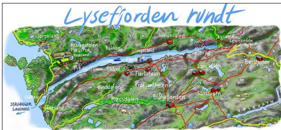
Figur 6.1. Stavanger Turistforenings satsing Lysefjorden rundt ( https://lysefjordhikes.dnt.no/ ).