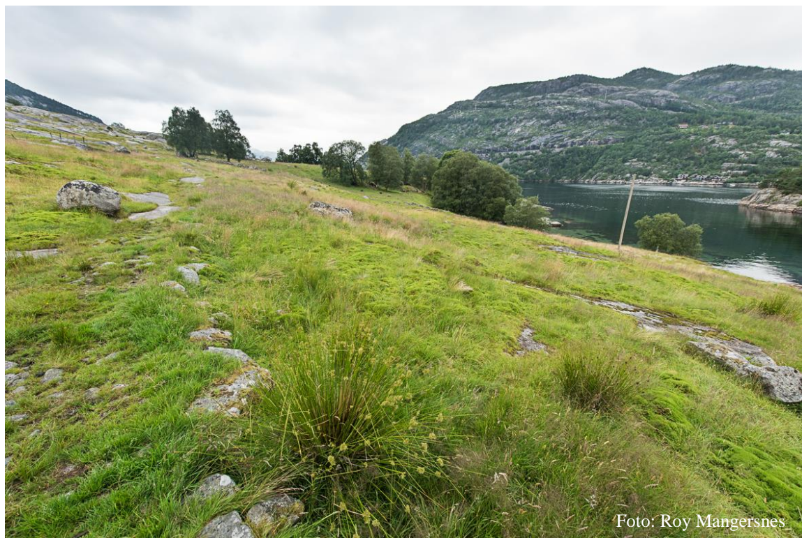
Fine åpne beiteområder på Bergsholmen ytterst i Lysefjorden.

I skogområdene hvor det ble foreslått hogst og rydding av småtrær ser det ut til at tiltak ikke er gjennomført i henhold til skjøtselsplanen. Noe skog- og trefrydding er foretatt i områdene omkring husene, men trolig ikke nok og her er det nytt oppslag av unge trær. Det står fortsatt en del døde frukttrær og er ikke plantet nye. Det ble søkt om, og innvilget midler til fjerning av båtvrak. Dette er fjernet.